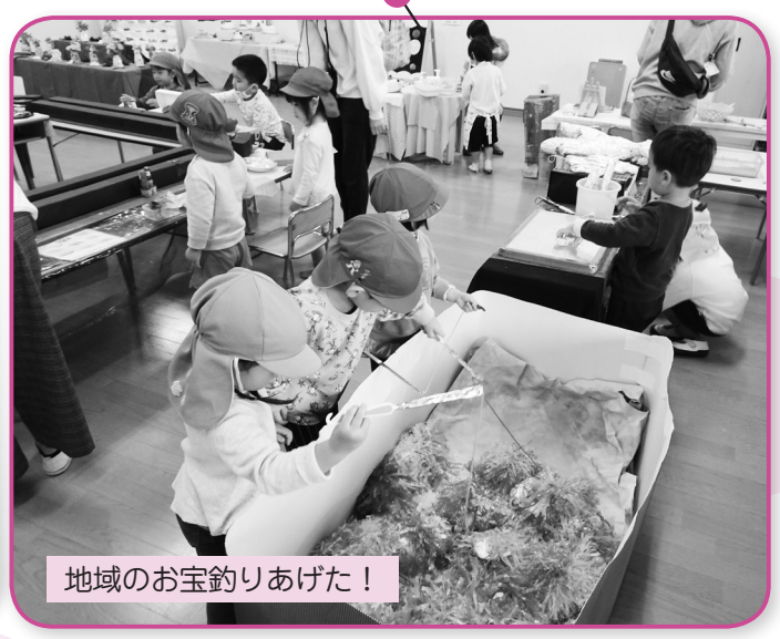
地域のお宝釣りあげた!