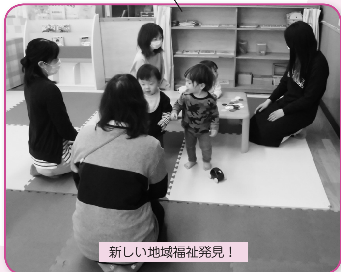
新しい地域福祉発見!