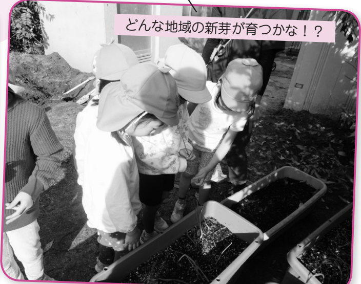
どんな地域の新芽が育つかな!?