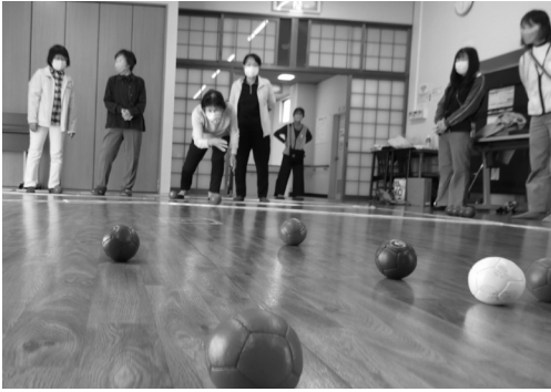
ボランティアさん活躍中！ (たかつきふれあいひろば ポッチャにて)