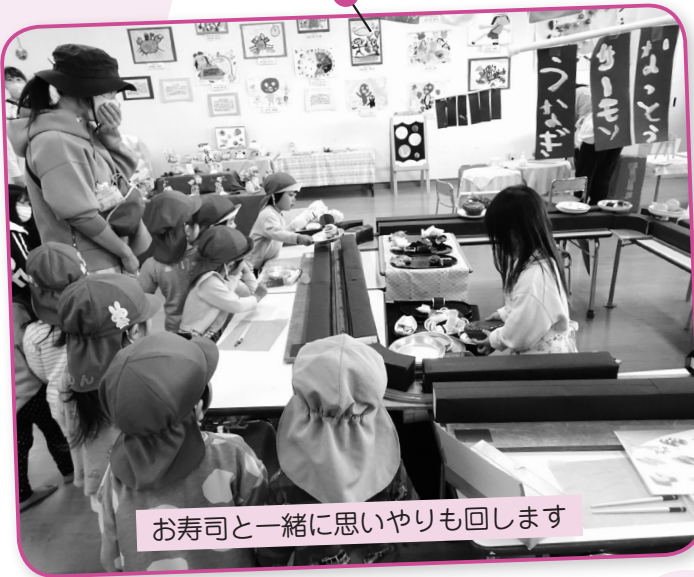
お寿司と一緒に思いやりも回します